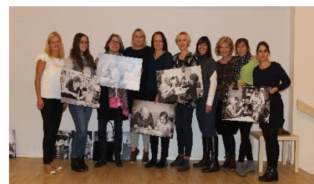
Kick-off meeting, Praha