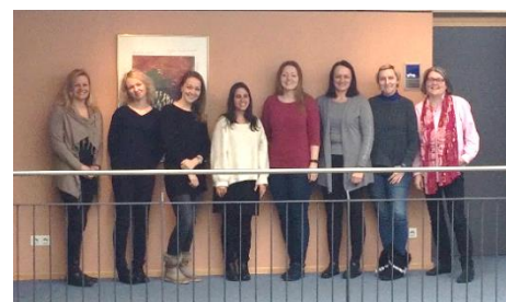
Zweites Projekttreffen in Cham