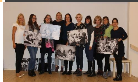
Erstes Projekttreffen in Prag

Basierend auf diesen Ergebnissen setzen die Partner die Entwicklung des Trainingsprogramms fort, konzipieren die Train-the-Trainer Veranstaltung und beginnen mit der Pilotierung.