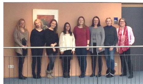
Deuxième rencontre à Cham

Co-funded by the Erasmus+ Programme of the European Union