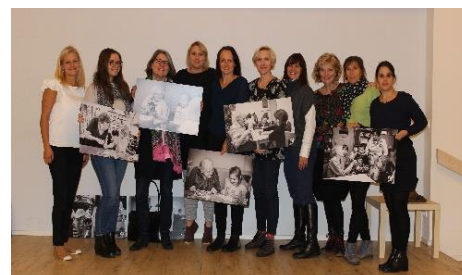
Uvodno srečanje v Pragi