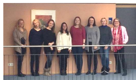
Drugie spotkanie w Cham

Co-funded by the Erasmus+ Programme of the European Union