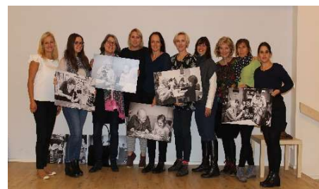
Pierwsze spotkanie w Pradze