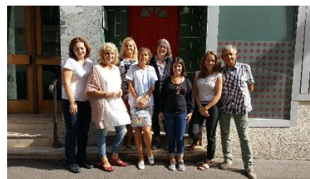
Třetí projektové setkání, Paříž

V příštích měsících se projektoví partneři zaměří na dokončení struktury registru aktivit a testování softwaru před tím, než budou zpřístupněny veřejnosti.