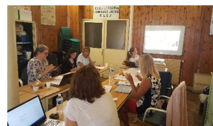
Třetí projektové setkání, Paříž

Co-funded by the Erasmus+ Programme of the European Union