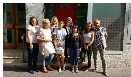
Trzecie spotkanie w Paryżu

W ciągu najbliższych miesięcy partnerzy projektu skoncentrują się na sfinalizowaniu struktury rejestru działań i przetestowaniu oprogramowania przed udostępnieniem go publicznie.