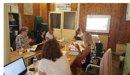
Trzecie spotkanie w Paryżu

Co-funded by the Erasmus+ Programme of the European Union