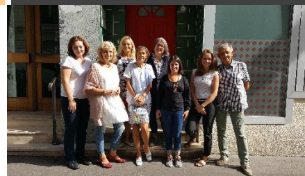
Drittes Projekttreffen in Paris

In den nächsten Monaten werden sich die Projektpartner weiter mit der Arbeit an Plattform und Inhalten des Aktivitätsregisters beschäftigen, bevor diese dann öffentlich zugänglich gemacht werden.