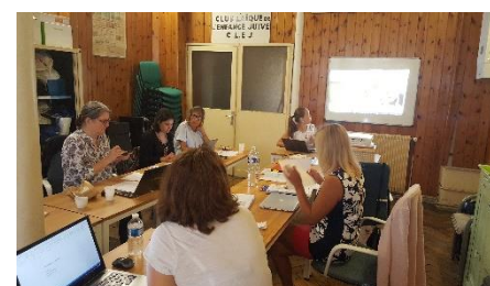
Troisième rencontre à Paris

Co-funded by the Erasmus+ Programme of the European Union