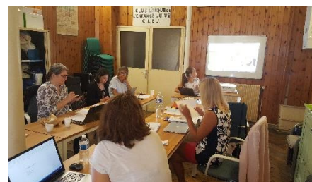
Tretje srečanje v Parizu