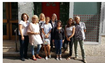
Tretje srečanje v Parizu

Vsak izmed partnerjev je predstavil 10 medgeneracijskih aktivnosti, ki jih bodo dodali v obravnavan spletni register. Aktivnosti pokrivajo 5 tematskih sklopov: ustvarjalne vsebine, kultura, komunikacija, gibanje in aktivnosti na prostem. V naslednjih mesecih se bodo partnerji posvetili zaključku in testiranju registra, preden ga bodo objavili za uporabo.