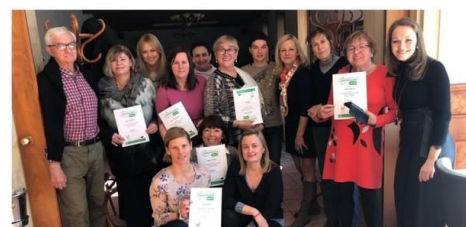
Séminaire de Formation des formateurs (Prague)