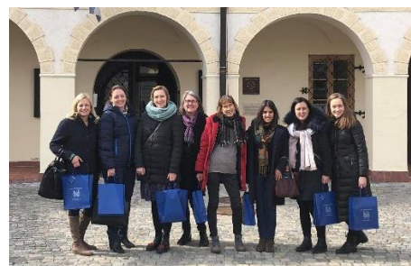
Réunion à Slovenj Gradec