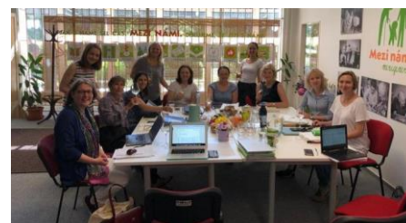
Peto srečanje projektnih partnerjev